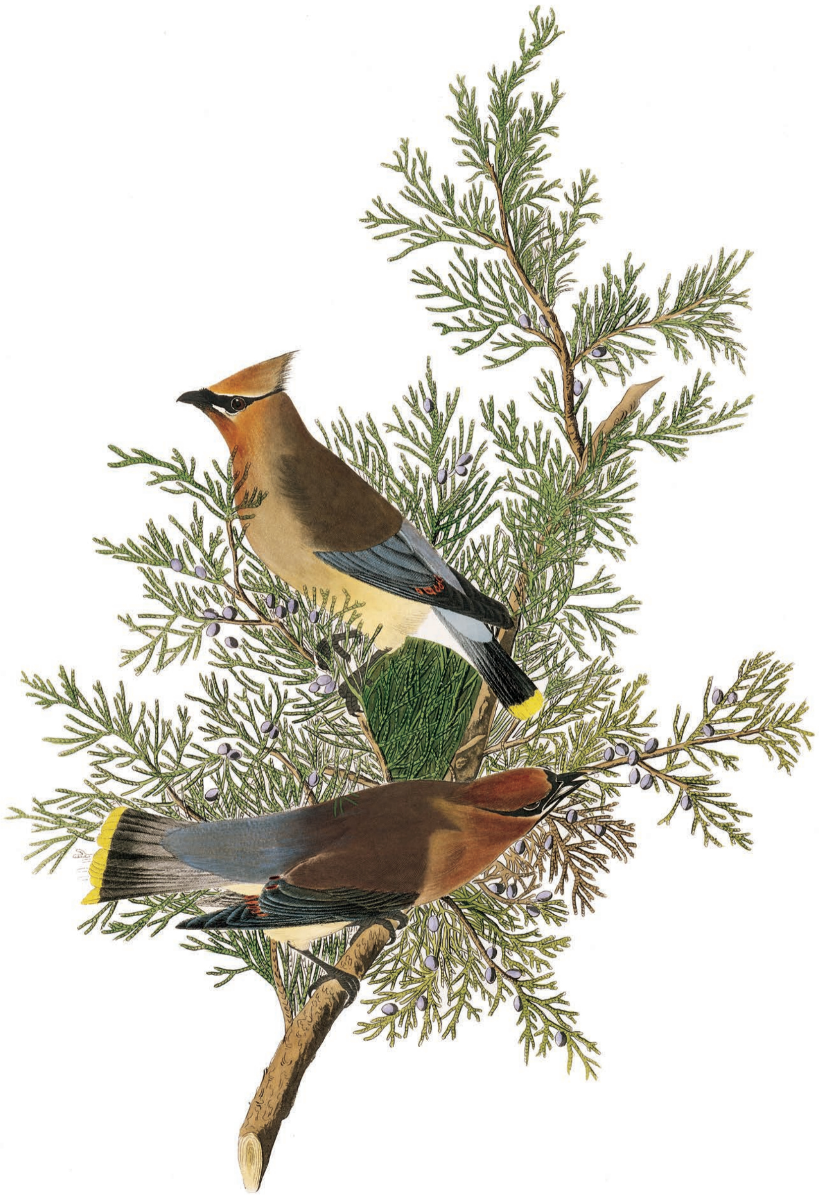
PLANCHE 325 Jaseur des cèdres