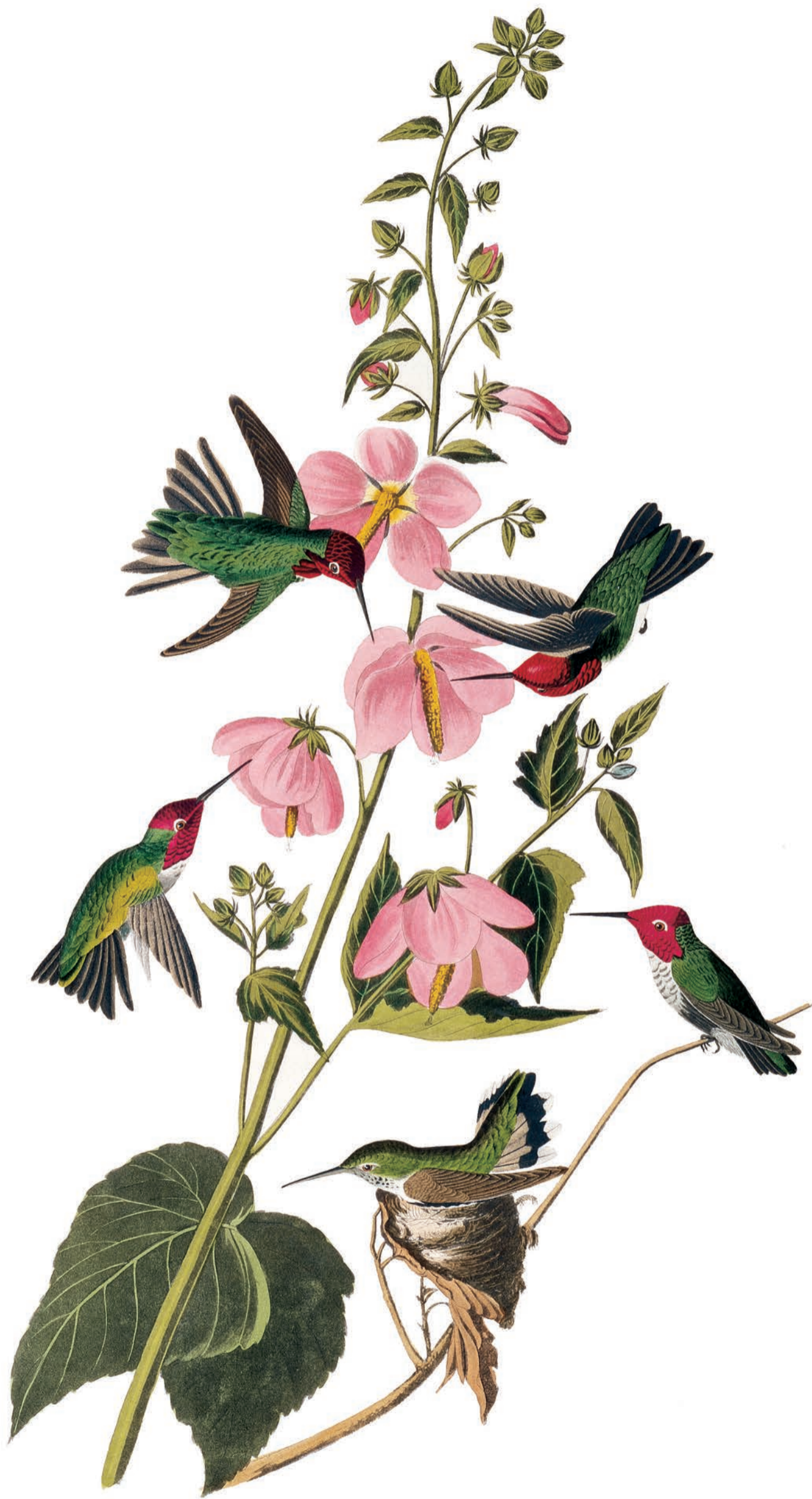
PLANCHE 251 Colibri d'Anna