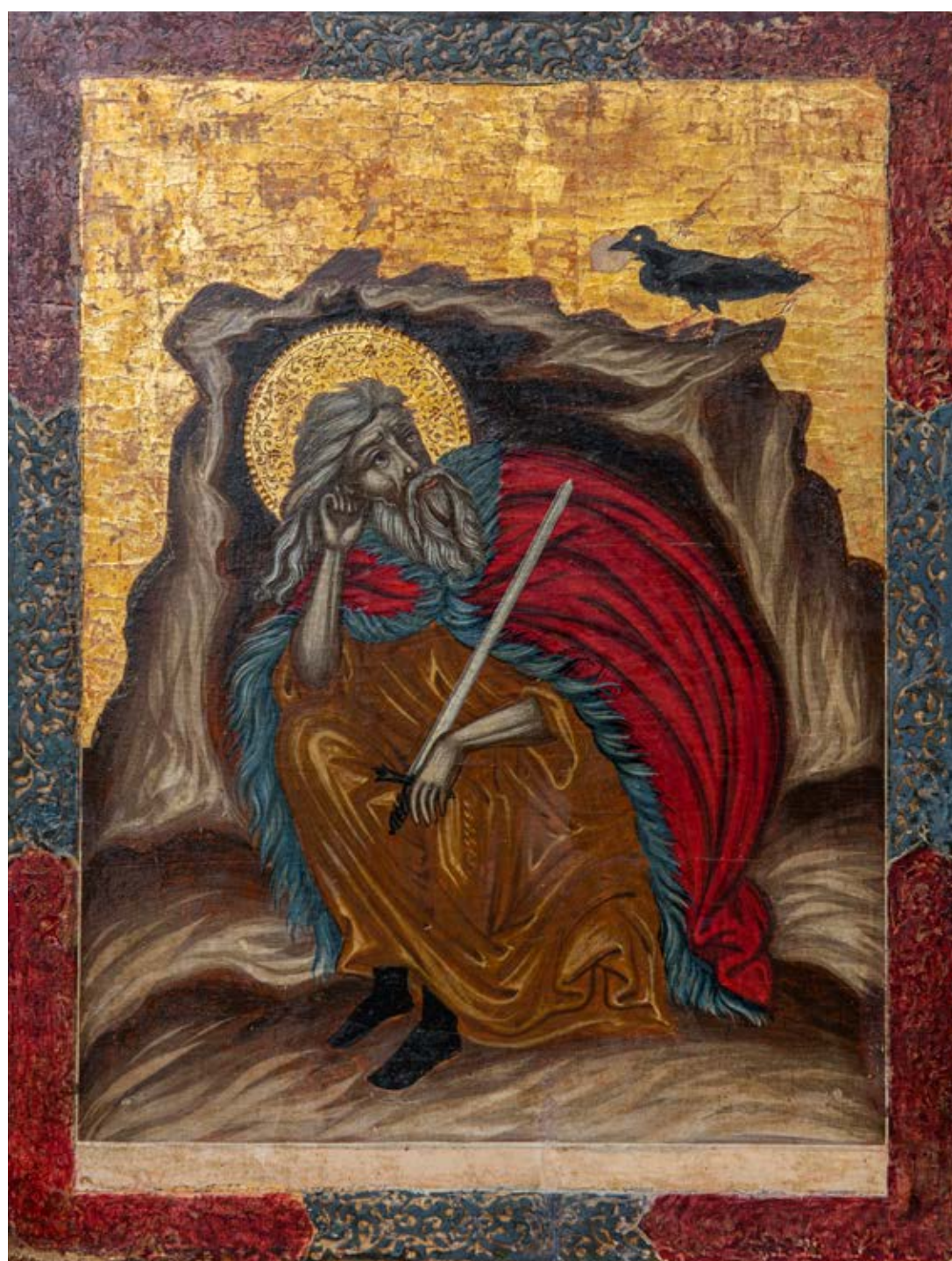
Le Prophète Elie Alep, Syrie, 1754, peinture à l'encaustique sur bois, 39 x 20,5 cm Sarba, monastère Saint-Sauveur, ordre basilien alépin

tel autour de lui que le besoin se fit sentir de créer un nouveau lieu, plus isolé encore, pour y faire vivre une partie des disciples. La Vie d'Antoine (34) relate comment Amoun, profitant du passage d'Antoine en Nitrie, lui demanda conseil sur le choix de ce lieu. Après une journée de marche dans le désert, Antoine désigna l'endroit qui devait devenir le site des kellia (cellules). Les fouilles menées dans les années 1960 montrent la juxtaposition de petites unités d'habitation séparées par des jardins. Chacune de ces maisons est conçue pour deux moines, unis par une relation de maître à disciple.