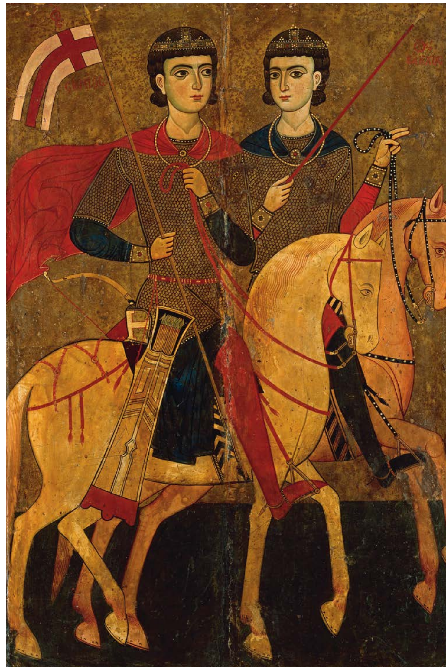
Saints Serge et Bacchus Sinai, Égypte, xiii e siècle, peinture à l'encaustique sur bois, 95,3 × 62,9 cm Mont Sinai, monastère Sainte-Catherine