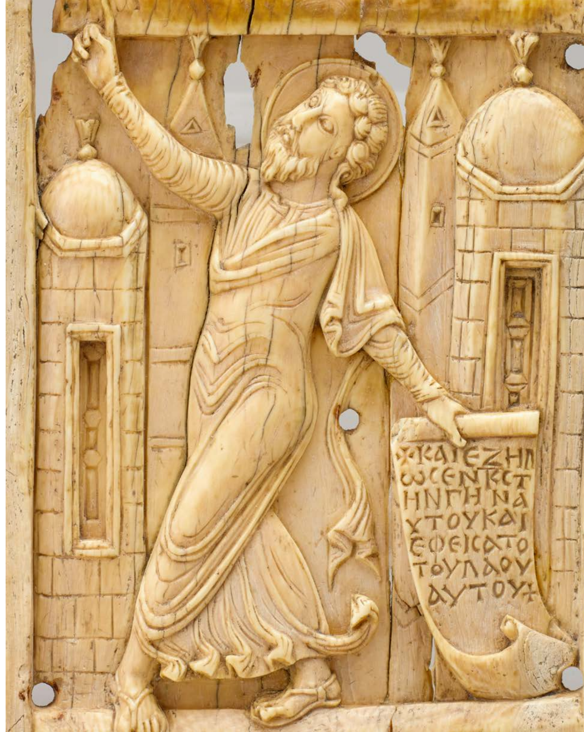
Chaire du Grado : Le Prophète Joël Alexandrie, Égypte, fin du vii e ou début du viii e siècle, ivoire, 10,2 × 8,7 × 0,7 cm Paris, musée du Louvre