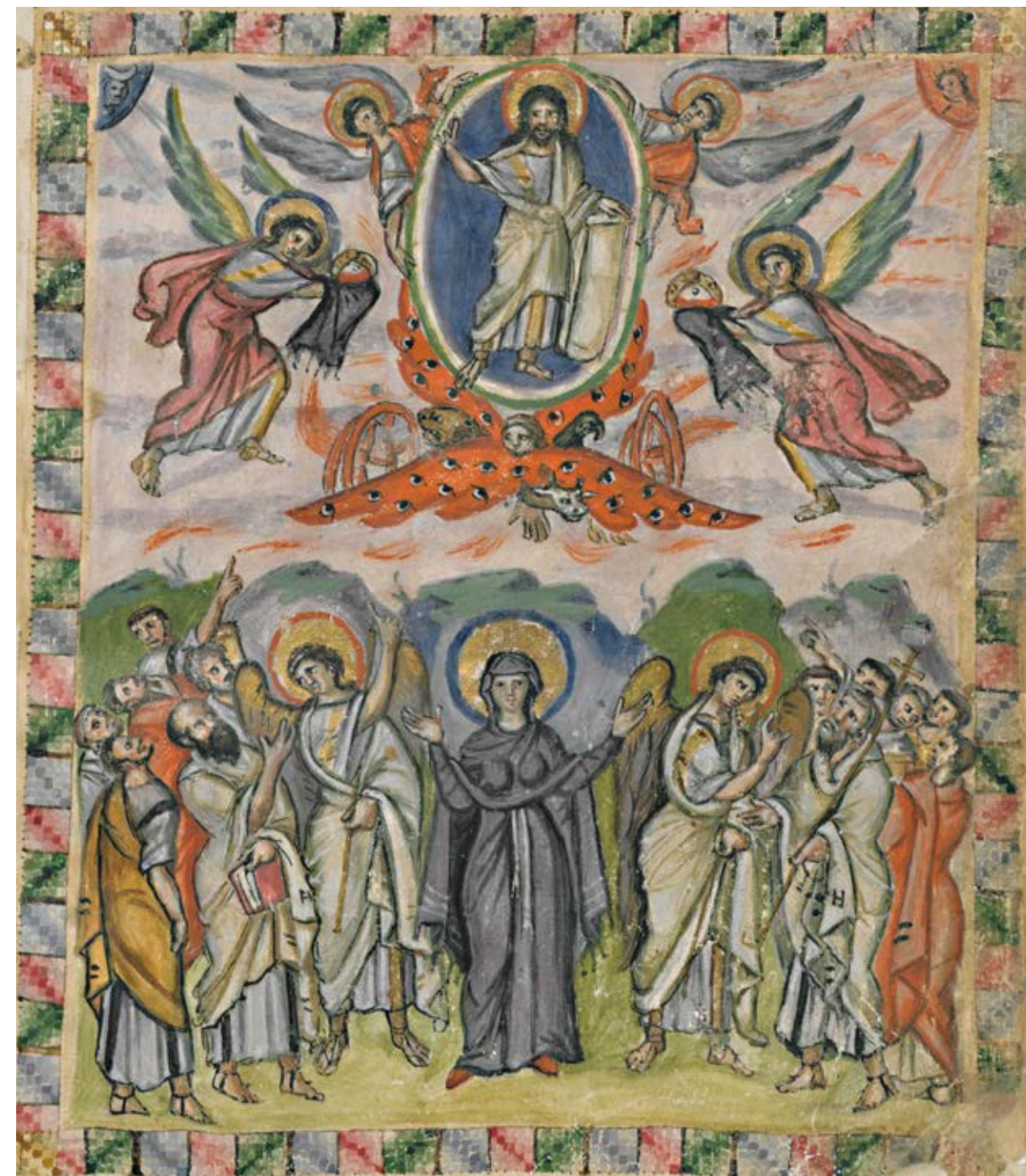
L'Ascension, dans Évangile de Rabbula Syrie, VI e siècle, manuscrit enluminé, 33,6 × 26,6 cm Florence, Biblioteca Laurenziana, cod. Plut. I, 56, fol. 13v