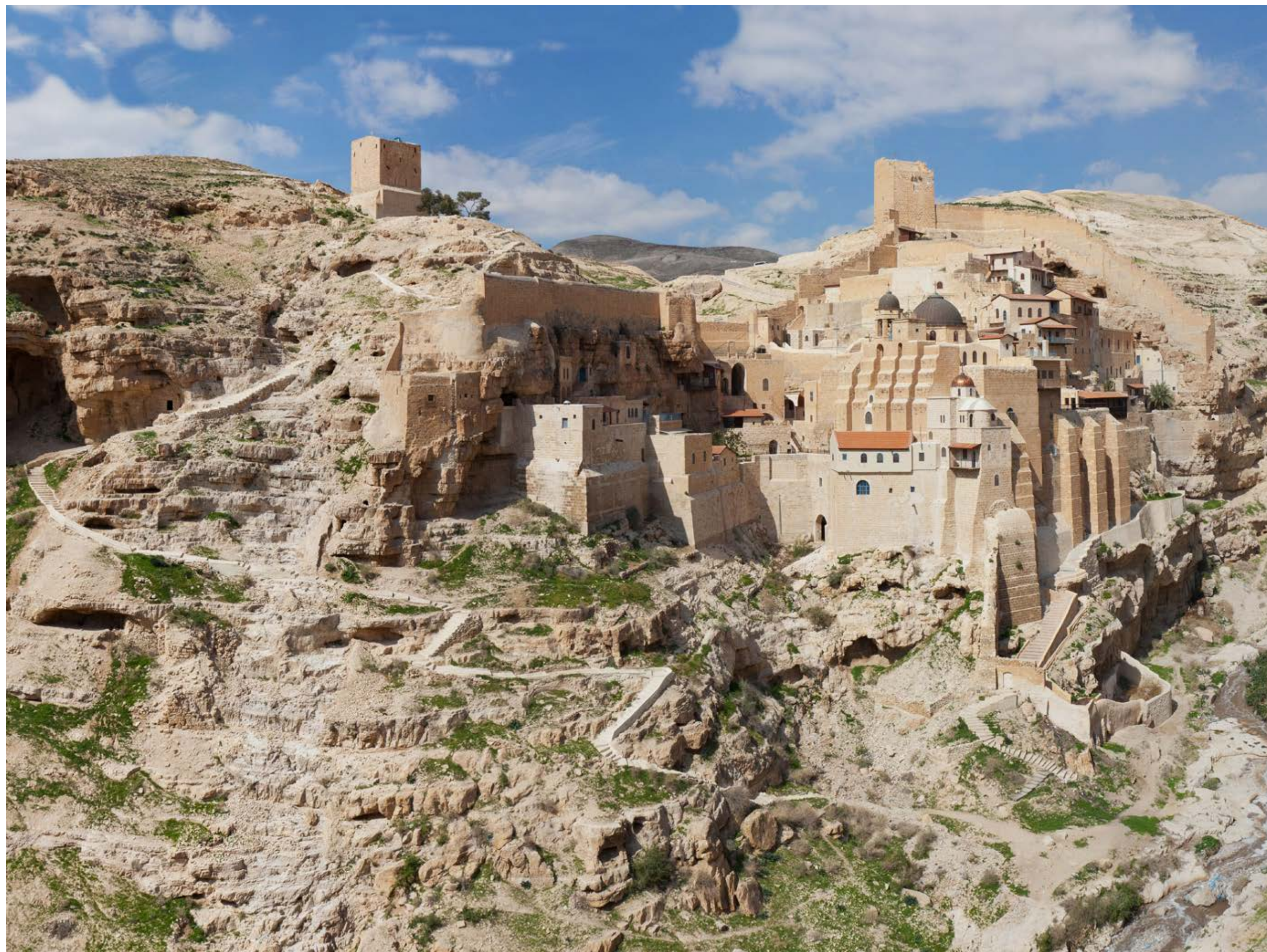
Monastère de Mar Saba, Cisjordanie Fondé au V e siècle

Le centre du pouvoir politique est à Constantinople. L'empereur convoque et préside les conciles, dont il fait appliquer les décisions. Il désigne aussi les titulaires des grands sièges épiscopaux. Cette centralité du pouvoir n'empêche pas les grandes cités orientales de rayonner sur le plan intellectuel et religieux, au point d'afficher une certaine rivalité qui tourne parfois aux controverses doctrinales. Antioche et Alexandrie sont les cités les plus en vue et gagnent le rang de patriarcat à côté de Rome et de Constantinople. Jérusalem est la cinquième ville à obtenir ce titre en 451. Sur ce très large territoire, la culture grecque dominante compose avec l'enracinement local des Églises, copte en Égypte et araméen en Syrie et en Mésopotamie.