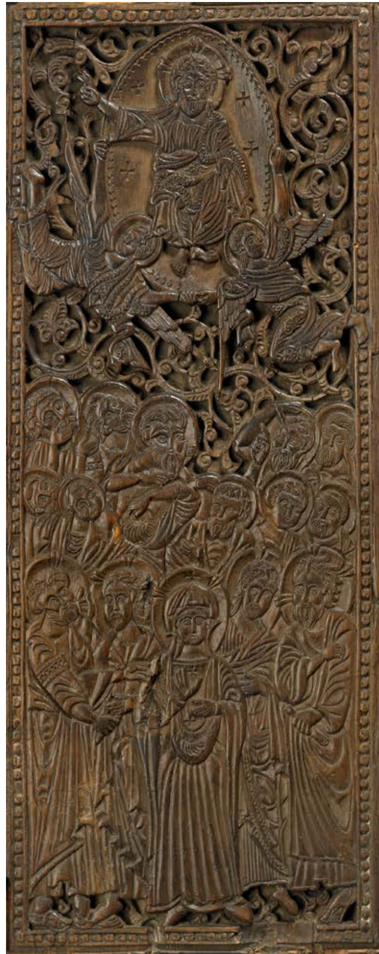
Panneaux d'écran : Pentecôte et Ascension Église de la Mo'allāqa, Le Caire, vers 1300, bois, 31 × 13,1 cm chacun Londres, The British Museum