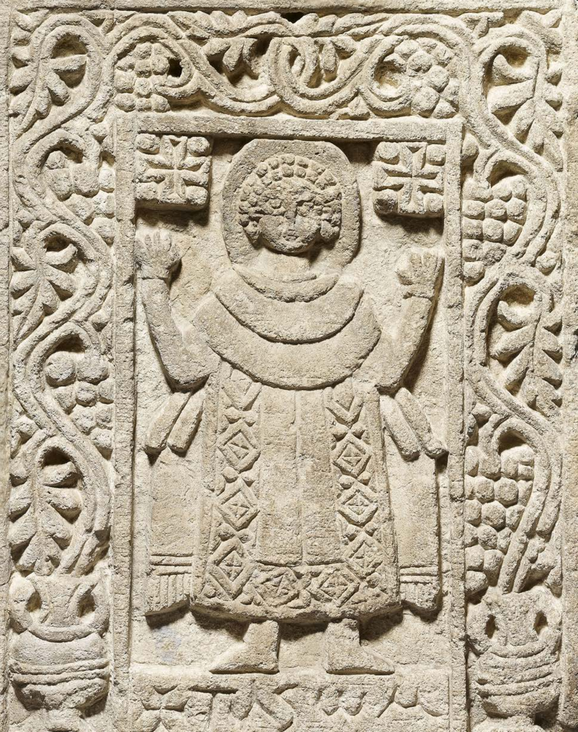
Page de gauche Stèle : Saint Pacôme Saqqarah (?), VI e -VII e siècle, calcaire, 57 × 44 × 14 cm Londres, The British Museum