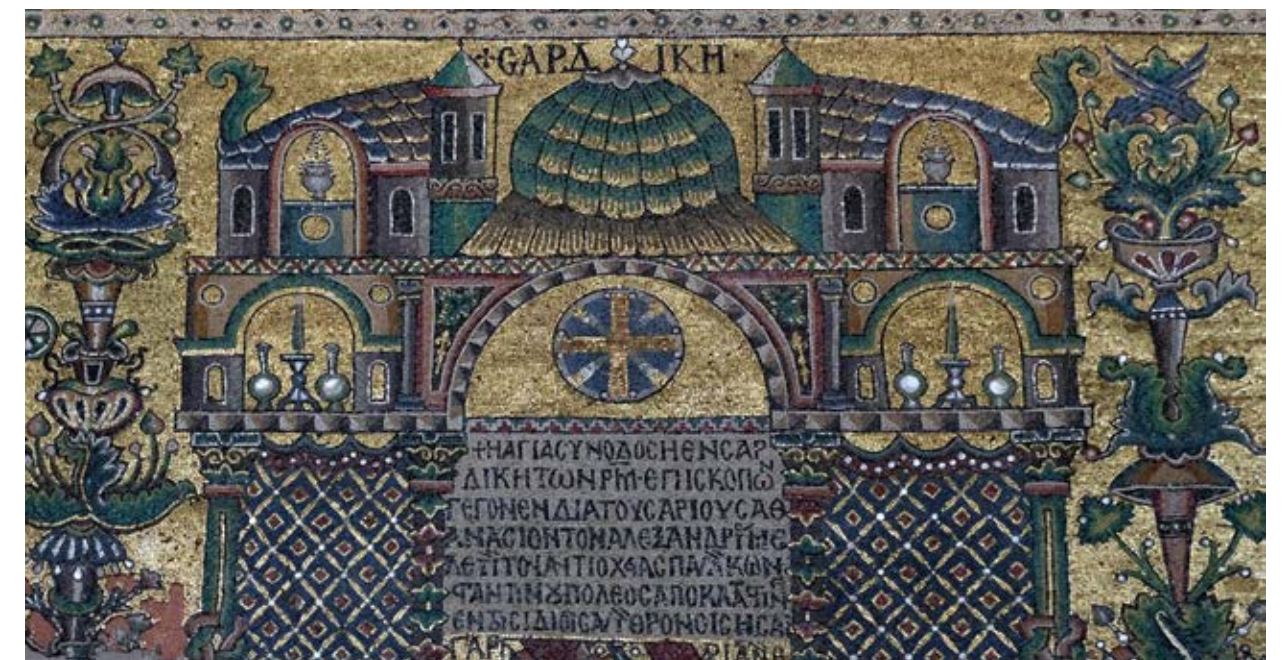
Page de gauche et ci-contre Archange et église Basilique de la Nativité, Bethléem, Cisjordanie, 1165-1169, mosaïque

Ainsi s'éclaire la pluralité et la richesse d'un phénomène artistique – architecture, fresque, mosaïque, boiserie, orfèvrerie, enluminure, peinture d'icône, textile... – à travers de vastes territoires et ses évolutions au fil d'une histoire mouvementée. Cette approche résolument patrimoniale servie par une illustration abondante se démarque d'une vision purement socio-historique pour offrir un décloisonnement géographique ou communautaire à même de révéler la dimension civilisationnelle de la culture chrétienne du Proche-Orient, de l'Euphrate jusqu'au Nil.