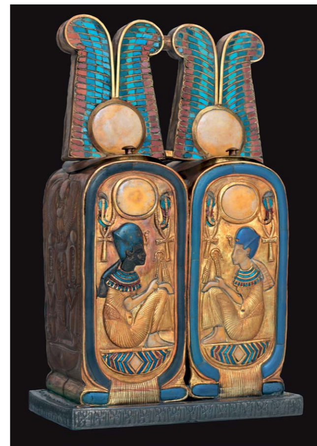
Boîte à onguents en forme de cartouches (or, cornaline, verre coloré, argent)