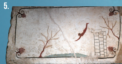
5. Nécropole de Posédonia, tombe du Plongeur, face intérieure de la dalle de couverture . Le plongeur symbolisait probablement le passage vers l'au-delà, la renaissance du défunt dans un état supérieur. On entrevoit, au centre, la brisure de la dalle. Paestum, Musée archéologique national.

Le succès du premier volume sur la Grèce Un collectif d'auteurs de premier plan La période : le cœur de la Grèce antique