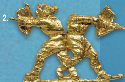
2. Applique de vêtement en or . Ces deux archers constituent un chef-d'œuvre de l'orfèvrerie scythe. En 1975, l'exposition au Grand Palais : L'Or des Scythes, trésor des musées soviétiques contribua à rompre avec l'image déplorable des Scythes, héritée d'Hérodote. Depuis, l'historien français d'origine ukrainienne Iaroslav Lebedynsky a notamment remis à l'honneur ce peuple des steppes eurasiatiques. H. 2,8 cm ; L. 4 cm ; P. 1,55 g. Panticapée (Kertch, Crimée), IV e siècle avant notre ère, Paris, musée du Louvre.

Sous la direction de Catherine GRANDJEAN