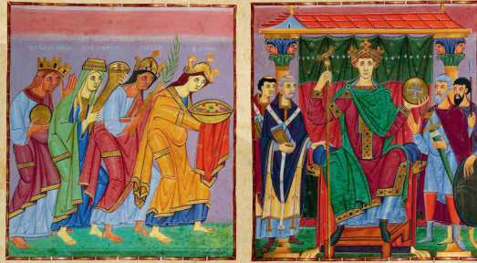
Slavonie, Germanie, Gaule et Rome évêtant hommage à l'empereur Otton III. (enluminure extraite du manuscrit des Évangiles d'Otton III). Les quatre parties de son empire lui apportant des cadeaux en signe de soumission, tandis qu'il est entouré de dignitaires laïcs et ecclésiastiques.

Une très riche iconographie et une cartographie originale