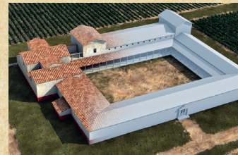
La villa de Loupian, dans l'Hérault (début du V e siècle). La luxueuse villa gallo-romaine de Loupian, qui existe depuis le Haut-Empire, est au cœur d'un important domaine agricole. Remaniée au I er siècle, puis intégralement transformée au début du V e siècle, son propriétaire la fait alors agrandir et monumentaliser, tout en la couvrant de mosaïques sur une surface de 450 mètres carrés. Ce domaine montre la richesse et le mode de vie encore préservé des élites aristocratiques romaines, mais dans un empire désormais chrétien : dans les premières décennies du V e siècle, une église est construite à 800 mètres au nord de la villa.